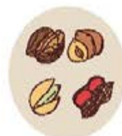
Coques de fruits secs broyées (noisettes, noix, pistaches, cacahuètes, ...)