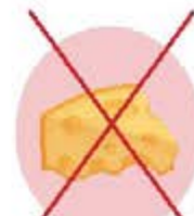
Fromages et laitages