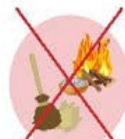
Poussières et cendres