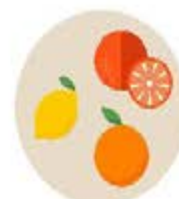
Agrumes* (avec parcimonie)