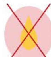
Huile, sauce, graisse, jus, vinaigrette