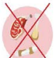
Viandes et os