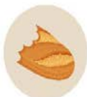
Morceaux de pain (avec parcimonie)