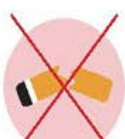
Mégots de cigarettes