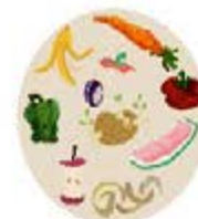
Épluchures et morceaux de fruits et légumes*