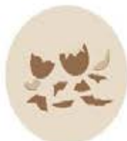
Coquilles d'œufs broyées