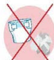
Couches et lingettes