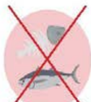
Poissons et arêtes