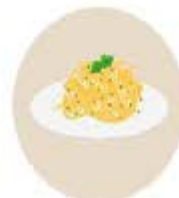
Restes de repas d'origine végétale (hors viande et sauce)