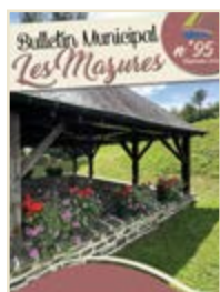
Fleurissement 2023 du lavoir rue du Bochet Bas

«Croyez en vos rêves et ils se réaliseront peut-être. Croyez en vous et ils se réaliseront sûrement.» - Martin Luther King