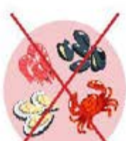
Fruits de mer