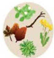
Déchets de jardin y compris fleurs fanées