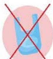
Sacs plastiques (même biodégradables)