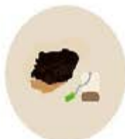
Sachets de thés, marcs de café et filtres